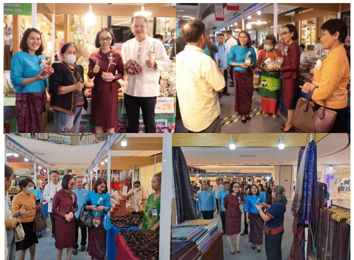
ประธานเดินเยี่ยมชมบูธ และให้กำลังใจผู้ประกอบการภายในงาน