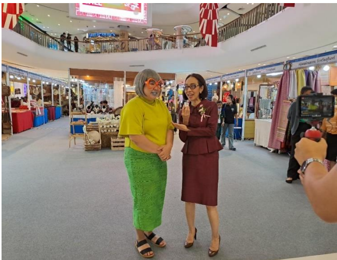
Influencer (เคธี & จอร์จ ) ประชาสัมพันธ์สินค้าภายในงาน